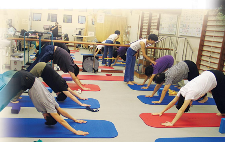
服務使用者可參與瑜伽訓練課程以提升身體素質。 Yoga classes enhancing physical, psychological and spiritual conditions of the service users.